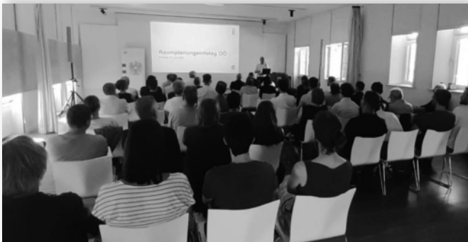
Raumplanungsinfotag am 24. Juni 2025 in Linz

Zwischenzeitlich gab es darüber hinaus mehrere informelle Arbeitstreffen zwischen dem Ausschuss und der Leitung der Fachabteilung, bei welchen jeweils aktuelle Raumordnungsthemen besprochen wurden.