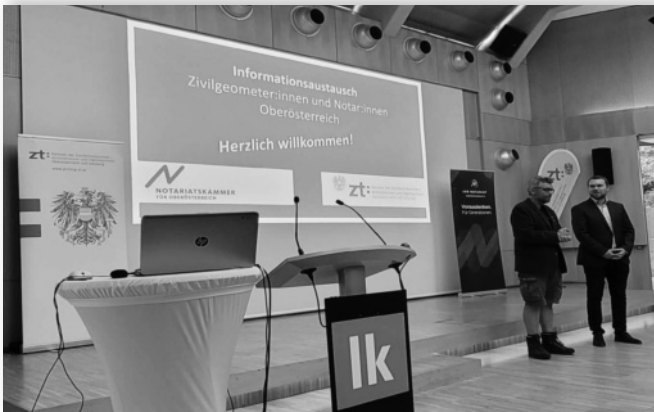
Die Geometer:innen und Notar:innen aus Oberösterreich trafen sich zuletzt im Mai 2025. Die Salzburger Kolleg:innen im November 2024 und Oktober 2022.

Die Aufgabe einer Fachgruppe ist es, ihren Mitgliedern einen Rahmen für fachlichen wie kollegialen Austausch und Weiterentwicklung zu bieten.