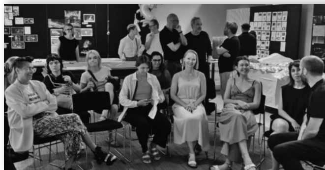
Architekturklasse © AuBenegg / ZT:OÖundSBG

Bei der Veranstaltung Visionen für Schallmoos Ende 2024 entstand die Idee, gemeinsam mit der Stadt Salzburg einen weiteren Abend mit dem Schwerpunkt Schallmoos zu gestalten – dieser Stadtteil rückte in den Fokus der Stadtplanung als ein Areal mit großem Entwicklungspotential. Die Vorbereitungen laufen.