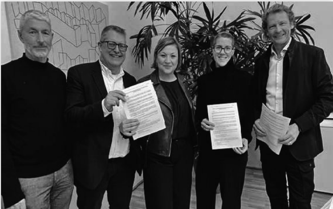
Unterzeichnung der Vereinbarung zur Umsetzung zeitgemäßer Baukultur

nen präsent, wurden u.a. eingeladen, die Positionspapiere der Bundeskammer „Klima, Boden und Gesellschaft“ und „Endlich einfacher bauen“ vorzustellen. Im November 2025 gibt es einen sektionsübergreifenden Infotermin an der Kunstuniversität Linz, wo wir Studierende über den Berufszugang informieren. An der Fachhochschule Wels startete im Herbst der Bachelorlehrgang für Architektur, wo wir uns ebenso einbringen werden.