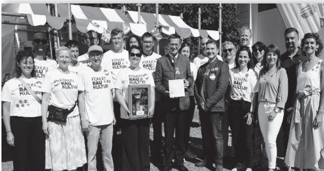
Ortsbildmesse Frankenburg

ang-Puchheim (2023) sowie ein Österreich-Bild aus dem ORF Landesstudio Salzburg Visionäre mit Verantwortung - Ziviltechnik als Basis der Zivilisation (2024). Der breiten Öffentlichkeit wurde damit gezeigt, durch welche vielfältigen Leistungen Ziviltechniker:innen zur Gestaltung zukunftsfähiger Lebensräume beitragen und wie sehr die Menschen in ihrem alltäglichen Leben von ZT-Projekten profitieren.