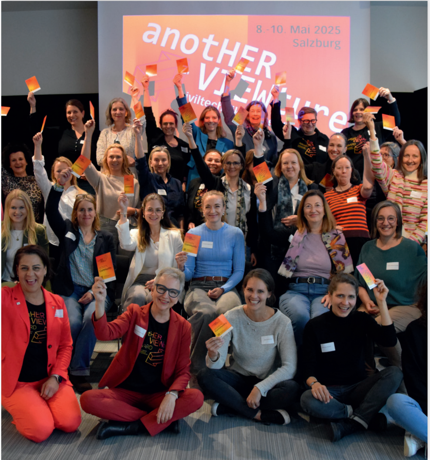
Ziviltechnikerintage 2025 in Salzburg