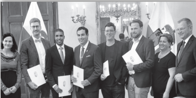
Vereidigung am 5. Juni 2024

Seit ich Präsidentin bin, war ich bei allen Vereidigungen in Oberösterreich (immerhin vierzehn an der Zahl) sowie bei weiteren vier (von insgesamt elf) Vereidigungen in Salzburg. Es ist nicht nur für die Landeshauptleute ein Wohlfühltermin. Die Gelegenheit, mit unseren neuen Mitgliedern zu sprechen, will ich unbedingt nutzen. Daraus entwickeln sich oftmals weitere Kontakte, und die Scheu, auf Funktionär:innen zuzukommen, wird ganz einfach abgebaut. Nicht zu unterschätzen ist der lockere Kontakt, den man mit den Landeshauptleuten hat. Man kann auch bei deren knappen Zeitressourcen immer wieder Themen deponieren oder am kurzen Weg um spezielle Gesprächstermine ersuchen.